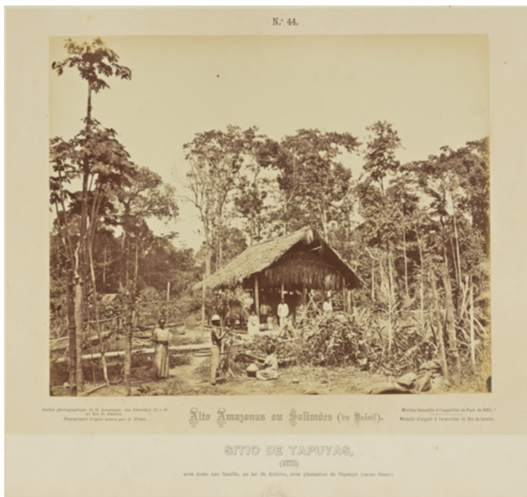
Figura 01 - Sítio de Tapuyas no rio Negro, por Christoph Frish, 1867.