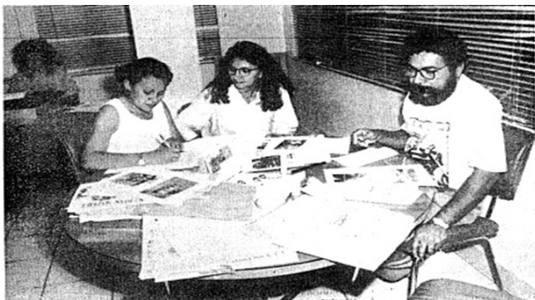
Figura 01 – Fiscais do trabalho durante produção de relatório de inspeção